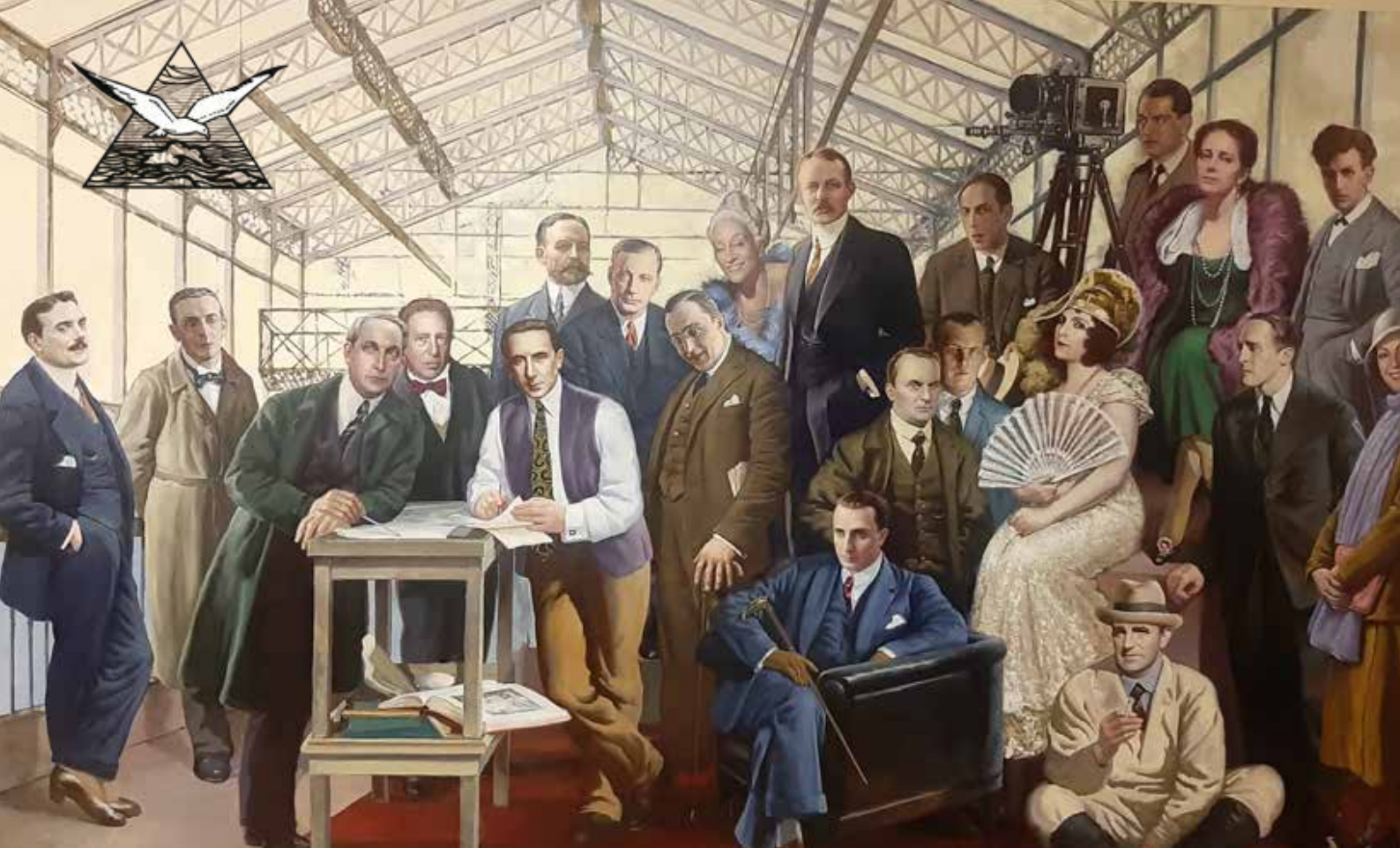
MAX LINDER, JEAN RENOIR, LOUIS JOUVET, MICHEL SIMON Y ONT TOURNÉ.